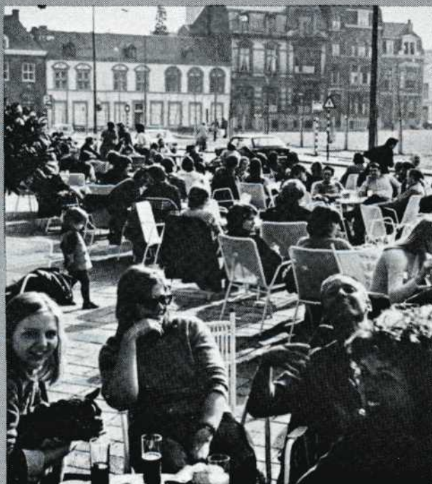
Het Vrijthof met zijn gezellige terrassen.