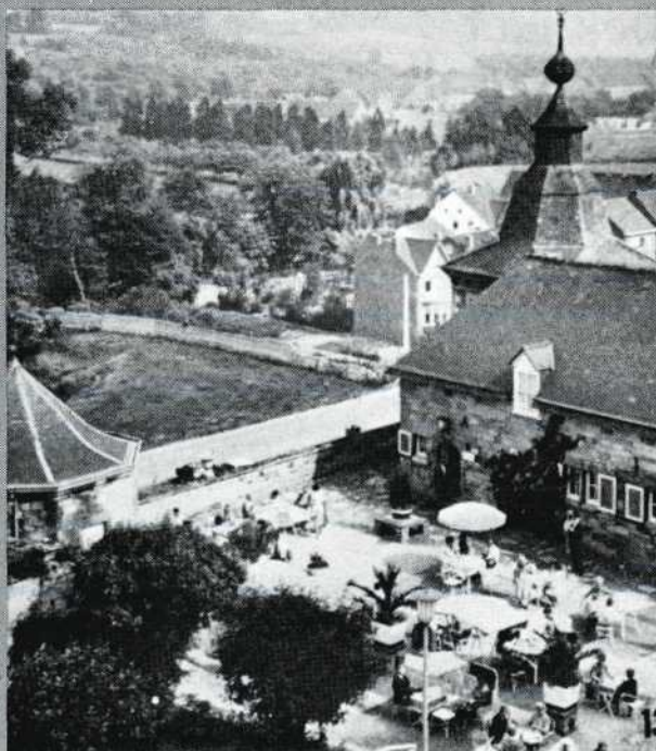
Maastricht, een onvergelykbare stad ... en o zo fotogeniek.