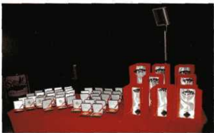
DE PRIJZENTAFEL MET DE GEBRUIKELIJKE MEDAILLES EN GLAZEN SCULPTUREN VAN DE BEROEMDE TUNESISCHE JASMIJN.

Als maker van 'Vervroegd pensioen', zit je toch wel wat onrustig als de onscherpte en slecht geluid ook je eigen film treft. Sterker: het valt je bij je eigen product natuurlijk dubbel zo hard op. De leuke reacties van het publiek op de komische momenten in de film bieden dan wat tegenwicht. Na afloop van de projectie waren er uit vele hoeken complimenten, die duidelijk maakten, dat er toch meer te beleven was geweest dan onscherpte en slecht geluid. Dat mag je dan ook hopen van de jury... Toen uitgerekend de Tunesische voorzitter van de jury een bijzonder positief betoog afstak over de film groeide de hoop op een mooie waardering. En die kwam er ook met de zilveren onderscheiding!