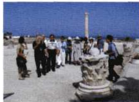
OP VEEL PLAATSEN IN HET NOORDEN EN MIDDEN VAN TUNESIË ZIJN NOG FRAAIE OVERBLIJFSELEN VAN HET ROMEINSE RIJK ZOALS DE THERMEN EN HET COLOSSEUM DAT OPNIEUW WORDT GEBRUIKT VOOR KLASSIEKE CONCERTEN.