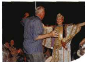
TJIDENS DE UNICA WORDT ER ALTIJD GOED GEFEEST. ER WAS EEN HEERLIJK DINER EN EEN SHOW VAN JONGLEURS EN DANSERESSEN.