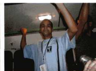
WE MOESTEN EVEN WACHTEN TOT HET HELEMAAL DONKER WAS, MAAR HET WAS DE MOEITE WAARD. DE WORLD MINUTE MOVIE CUP MONDDE UIT IN EEN SPONTAAN FEESTJE OP HET PODIUM TOEN DE TUNESISCHE INZENDING WINNAAR WERD. NET ALS IN NEDERLAND WERD VIA OPSTAAN DOOR HET PUBLIEK DE WINNAAR BEPAALD. NA AFLOOP VOOR HEM GEEN UMOSINE. MAAR GEWOON EEN OVERVOLLE STADSBUS.