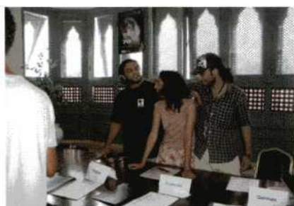
LEDEN VAN DE FTCA EN VRIJWILLIGERS ZORGDEN VOOR VERSPREIDING VAN DE INFORMATIE IN DE GANGBARE TALEN. DE TOESPRAKEN EN JURYSBESPREKINGEN WERDEN DIRECT VERTAALD EN VIA OORTELEFOONTJES WAS ALLES GOED VERSTAANBAAR.