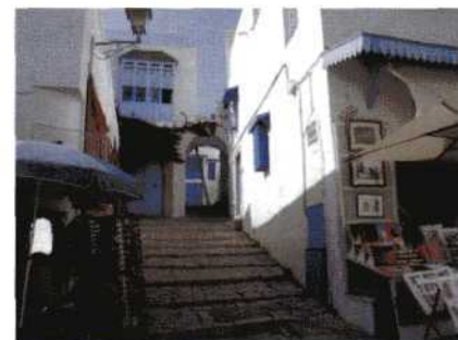
HET STADJE SIDI ABU SAÏD LIJKT GEMAAKT VOOR DE TOERISTEN, MAAR DE WITTE MUREN TEGEN DE HITTE EN BLAUWE DEUREN EN LUIKEN TEGEN DE INSECTEN ZIJN HEEL FUNCTIONEEL.