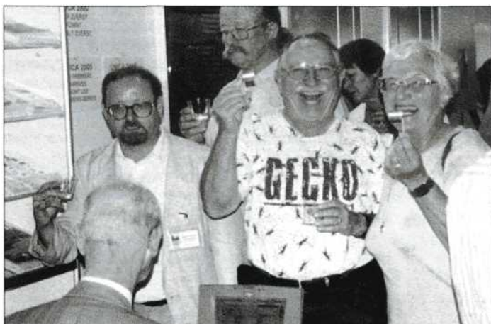
Volop belangstelling voor UNICA 200 in Nederland. Er schreven reeds 100 man in!

In het volgend nummer zullen de twee jeugdleden - die op uitnodiging van de NOVA meegingen naar Finland - Steven Geldof en Jarno Cordia en Piet van Eerden verslag doen van dit zo interessante festival. ■