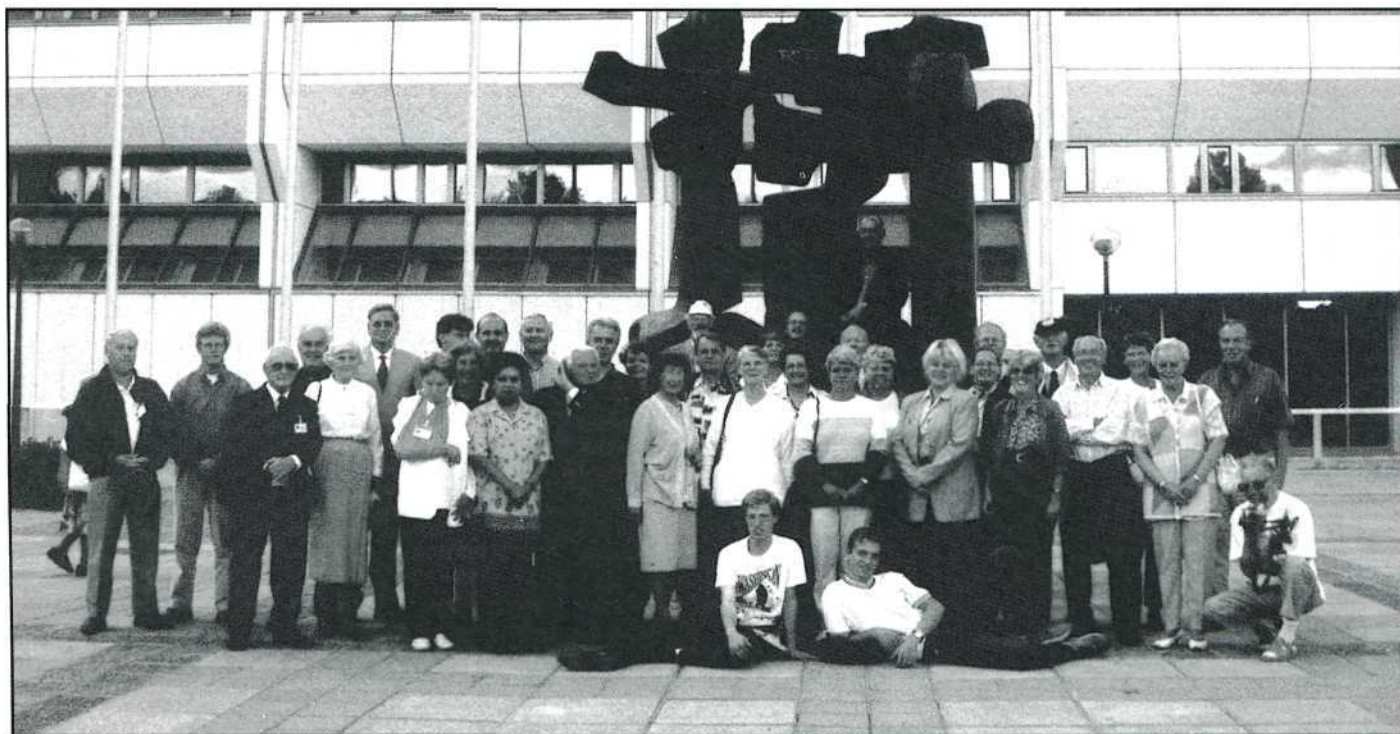
Het grootste deel van de Nederlandse deelnemers poseert voor de Town Hall waar de films werden vertoond

Drie kids gaven een prachtige balletvoorstelling. Heel mooi. Maar toen begonnen de toespraakjes en officieel gedoe. Dit alles gebeurde ook nog eens 4 keer. Want alles moest in het Engels, Frans, Fins en Duits. We hebben het redelijk goede programma van Fin-