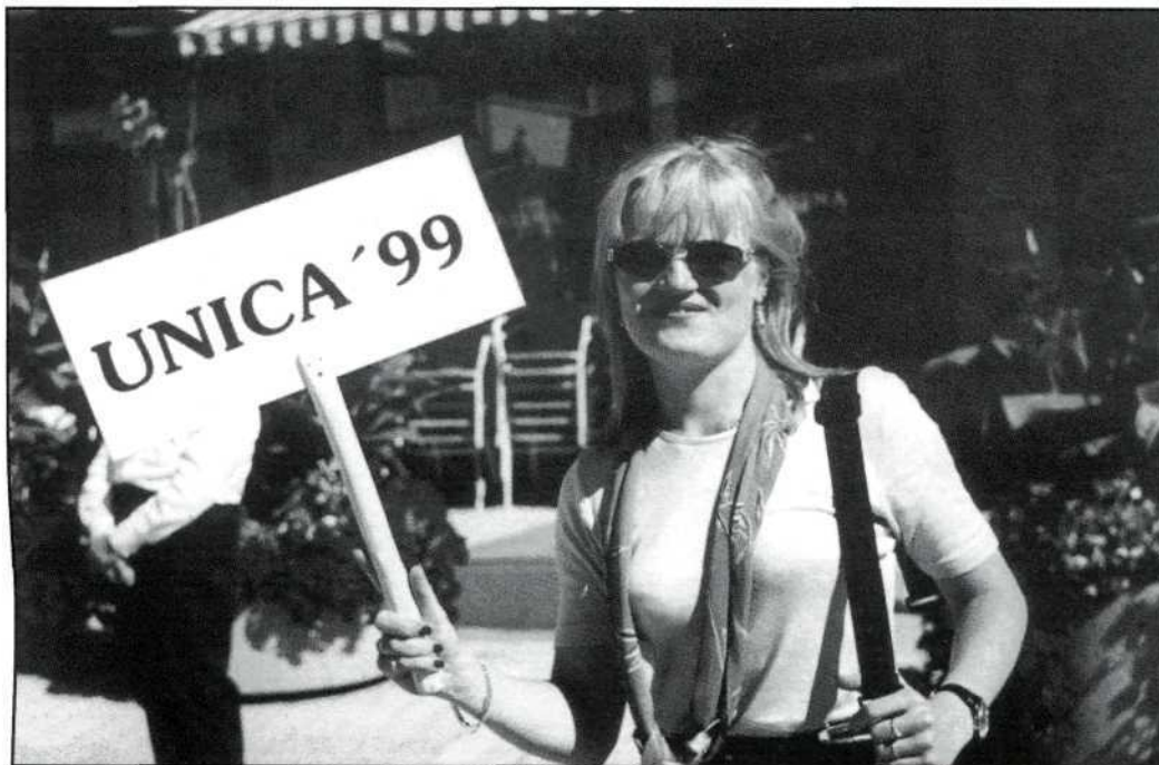
Een van de Finse gastvrouwen

Dit was een film waarin de komische belevenissen van een wollen shawl op de voet gevolgd worden, maar dit alles op zo'n manier gefilmd dat het haast een tekenfilm lijkt. Tijdens de aftiteling bleek ineens dat deze film was gemaakt door mijn Argentijnse kamergenoot dus ik had weer genoeg stof tot spreken. Nu zou ik een voor een alle