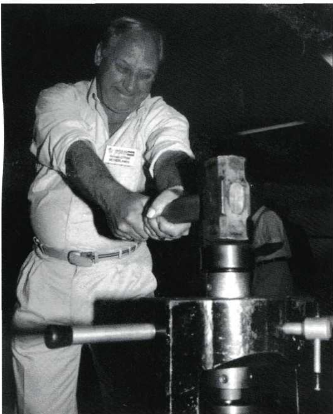
Er wordt munt geslagen.

naar huis moet komen. Daar vindt hij zijn overleden jongste broertje opgebaard in zijn dubbelrijs. Zijn wereld stort in. Drama volop dus. Schitterend gemaakt. Onduidelijk blijft waaraan het jongste broertje zo plotseling is gestorven.