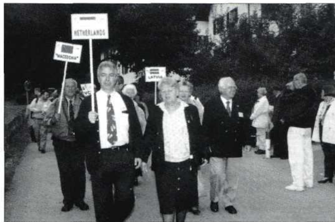
De Nederlandse delegatie lijkt wat klein.