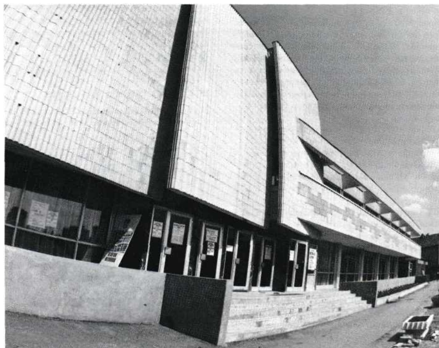
De entree van het imposante gebouw.