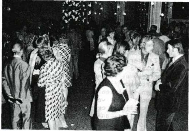
In de pauze inde Gurzenich-hal.