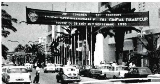
Publiciteit... en het Sousse congresgebouw.

lijk respect en liefde' het beste tot uitdrukking bracht.