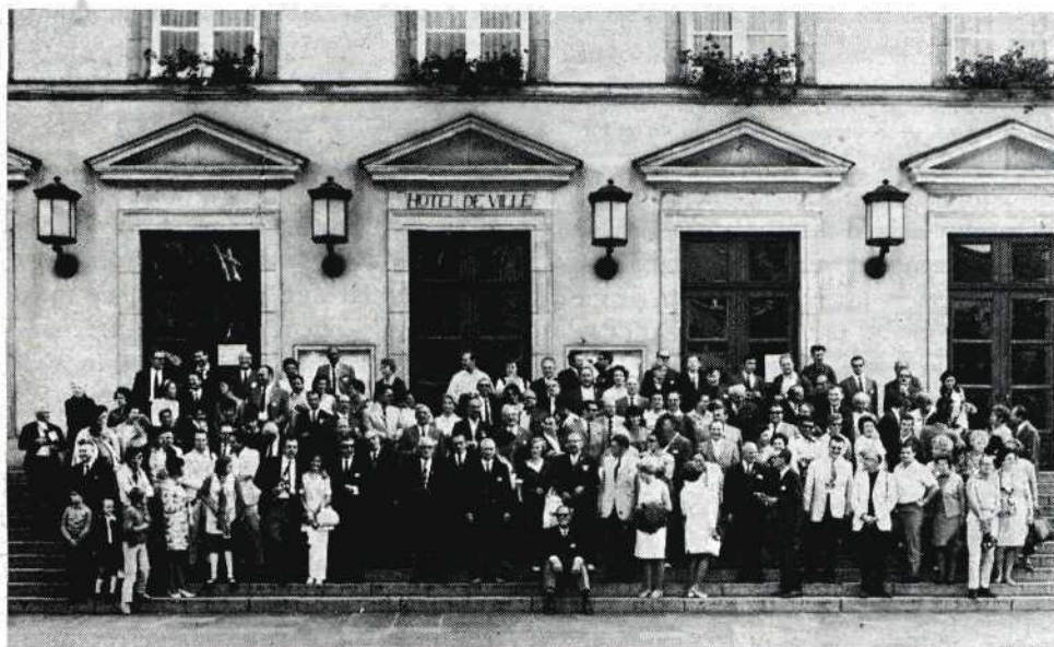
Een groot en internationaal gezelschap: de UNICA-gangers — sluit u er bij aan!