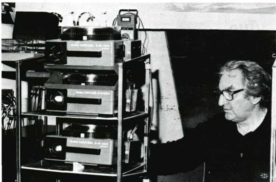
Een van de projectietorens van zijn dia-show.