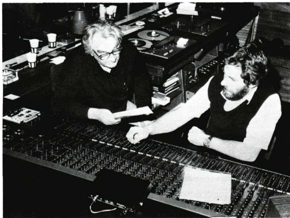
Vader en zoon achter het imposante mengpaneel van de geluidsstudio.