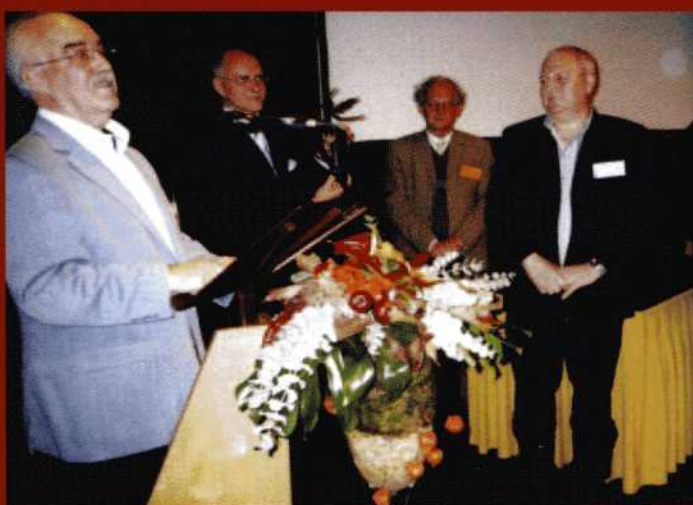
Prijzuitreiking tijdens de Nationale NOVA Manifestatie 2003 in Emmeloord.