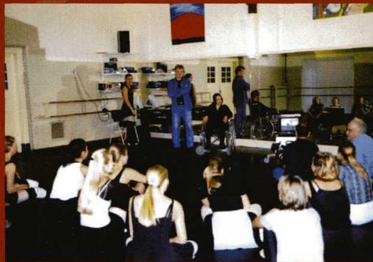
Regie-aanwijzingen tijdens "De Lege Spiegel", 1999.