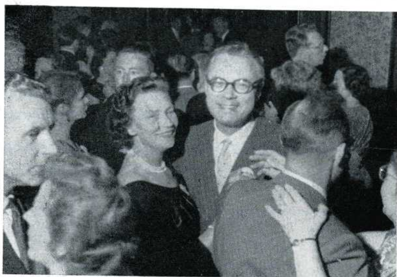
28 Heeft het middelste echtpaar wel één dans overgeslagen?