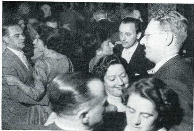
27 Gemêleerd gezelschap, Haarlem, Nijmegen, Amsterdam aan de dans op de vrolijke avond.