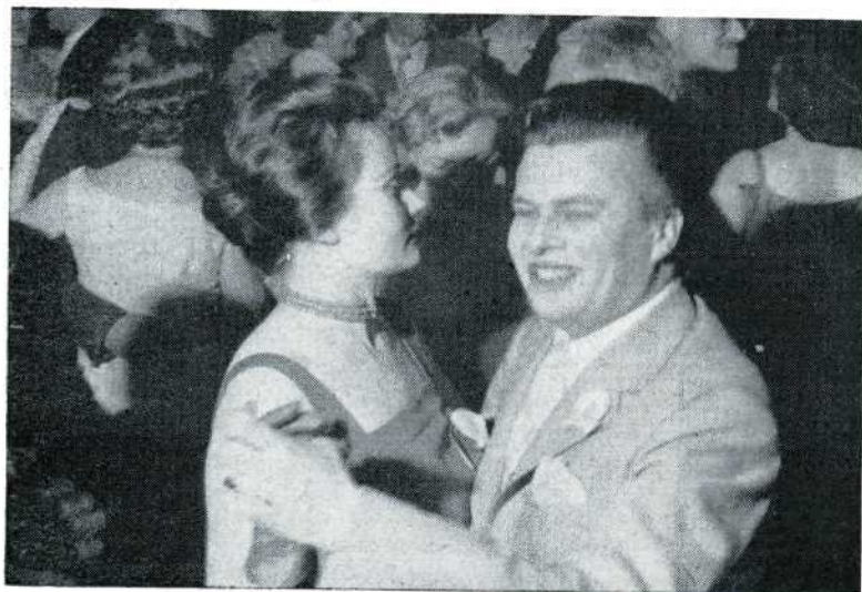
29 Ze wisten van geen ophouden.