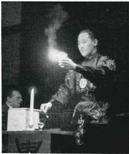
30 Grote indruk maakte de Chinees met zijn trappante mysteries.

Alle foto's redactie 'Het Veerwerk', Leica M3, soms met flits, soms met available light.