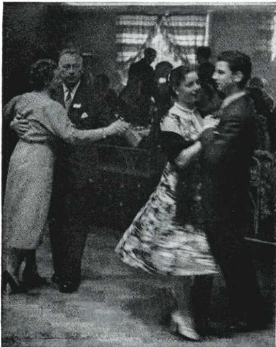
Jong en eh... niet meer zó jong vermaakten zich. D.B.

Direct daarop begon het diner in de stemmige zaal van 'De rustende Jager', waar tafelpresident Van Geest direct al een prettige stemming wist te kweken. In een gloedvolle speech deelde hij mede dat de volgende morgen het zee-aquarium niet bezocht kon worden omdat alle vissen daaruit al op de bordes lagen. U ziet op de foto hoe ze werden verslonden. Op de tafels lagen verder keurige menu's, in de vorm van een smallfilm-camera, waarbij uit de lens zelfs een klein stukje film stak. Loepjes brachten gedurende de eerste gang een half lunchkaasje per minuut op, omdat iedereen de filmstukjes wilde bekijken die op het menu waren geplakt. HAF-leden deelden mede dat er stukken gecensureerde film bij waren, waarop de koers van de loepjes ogenblikkelijk een halve lunchkaas opliep. Het zou wel goed zijn geweest als iedere scène van de wedstrijdfilms zo nauwkeurig ware bekeken als de stukjes die hier op tafel lagen! Diverse mensen werden tot speechen uitgenodigd en voorzitter Van Geest verdient een compliment voor zijn idee om een Limerickwedstrijd uit te schrijven. Een paar van de geestigste mogen hierbij afgedrukt worden.