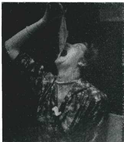
Dat ging er goed in!