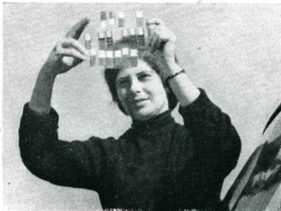
De puzzeltocht. Nauwkeurig werden de filmknipsels bekeken... waar moet ik heen? D.B.

Op internationaal gebied eindigde Nederland op de achtste plaats van 15 deelnemende landen; niet zo'n slecht resultaat. Veel hulde en dank werd gebracht aan de Commissaris van het buitenlands Contact, de heer J. J. de Jong, die vijf jaar veel goed werk heeft gedaan. De heer Ir. W. Brusse neemt nu zijn taak over. De nationale wedstrijd bevatte in totaal 64 films, 58 in de selectieklasse en 6 in de hoofdklasse. De voorzitter noemde het peil ongeveer hetzelfde als vorig jaar, de top was zeker even goed, maar er was ook veel