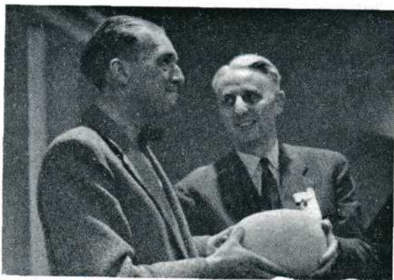
Kaas was altijd prijs. Prijzen waren altijd kazen! D.B.

Het voorstel om het blad onder de hele redactie van de NOVA te nemen kon niet worden uitgevoerd omdat het blad geen eigendom van de NOVA is, maar van de N.V. Uitgevers Mij. 'Focus', die naast de NOVA-leden nog veel meer abonnees heeft. De redacteur gaf uitleg van de situatie en deed een hartelijke oproep tot meer medewerking in de vorm van prima artikelen en foto's, uit-