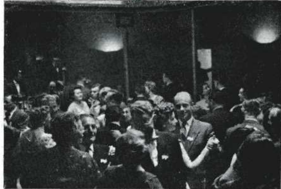
Hoe gezellig het was.