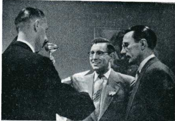
Nóg meer kaas voor de beste sterrijders en gewichts... heffers, nee, schatters. D.B.

Een prijs van f 50,— is door de Nederlandse Reisvereniging aangeboden in een speciale rubriek 'Reisfilms' en toen werd dringend gevraagd om de gunstige regeling met de Buma in stand te houden door de gevraagde lijst van vertoningen met muziek direct aan de secretaris te verzenden. De Notulen werden met veel dank aan de secretaris gearresteerd, het jaarverslag van de secretaris werd onder applaus goedgekeurd.