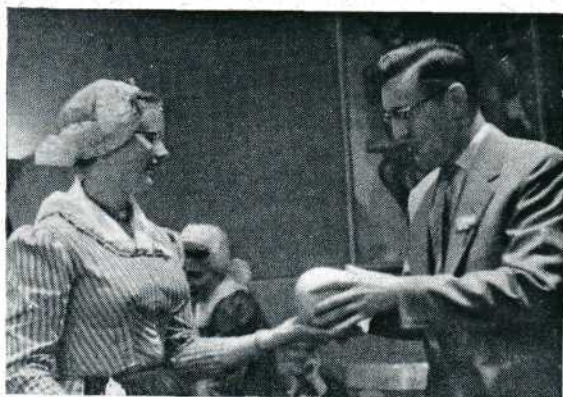
Wéér een kaas voor de verste rit.