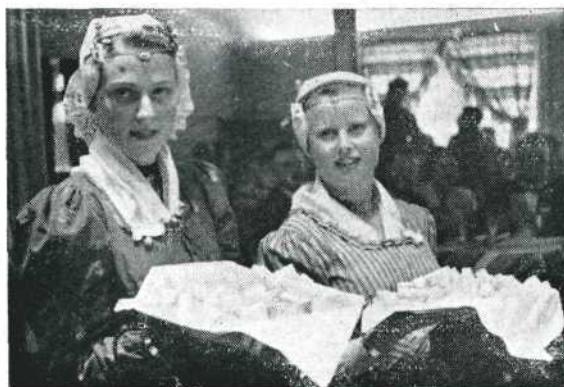
Westfriezen, met ... ja werkelijk, réuëuze stukken kaas!! D. B.

Toen werd een gezellig borreluurtje gehouden, waarbij vele oude vriendschappen werden vernieuwd of nieuwe werden gesloten. Daarna beklom de Alkmaarse heer van Meurs het podium, waarbij hij de prijzen van de sterrit uitreikte. Er waren 52 equipes, waarbij hij onder vrolijk gelach mededeelde dat de schoolopleiding in Nederland wel treurig was, want velen van de aanwezigen 'bleken geen bliksem verstand te hebben van het metrieke stelsel'. De kaas bleek precies te wegen 53 kg. en 850 gr. Eén meneer had geschat 122 gr. en kreeg tot ieder verbazing en vrolijkheid toch nog een troostprijs. De heer Renardel de la Valette kreeg de hoofd-