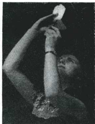
De 'filmviewster' met' haar menu.