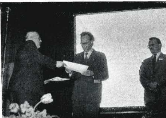
Prijsuitreiking bekroonde films. Hendriks wacht op de hoogste prijs.

De vraagsteller bedoelde de werkelijke met geluid opgezette film, immers een film met geluidsillustratie is feitelijk als stomme film opgezet. In de als zodanig opgezette geluidsfilm moet een eenheid zijn ontstaan van beeld en geluid, welke niet te scheiden zijn. Het is dus niet belangrijk op welke van de twee de nadruk ligt. In verband hiermede kwam naar voren dat in het NOVA-reglement voor de wedstrijd feitelijk een fout staat, nl. in de scheiding tussen geluidsfilm (waar hier be-