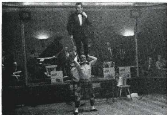
Engelse clowns gebruiken een stok als zakdoek.