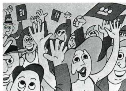
Gejuich, de troon is weer heel. De heren die het allemaal 'versierd' hebben worden gedekoreerd; onze arme timmerman, die het uiteindelijke werk deed, komt er niet aan te pas.