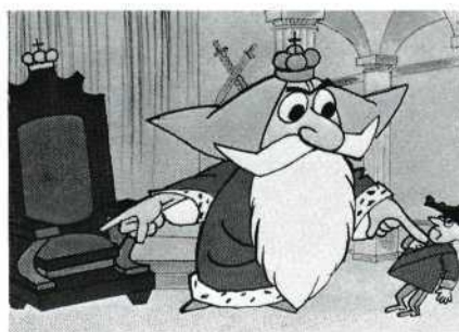
Afbeelding uit 'De Troon' van Jan van Weezenberg. Hiermee begint het verhaal: een poot van de troon is kapot gegaan.