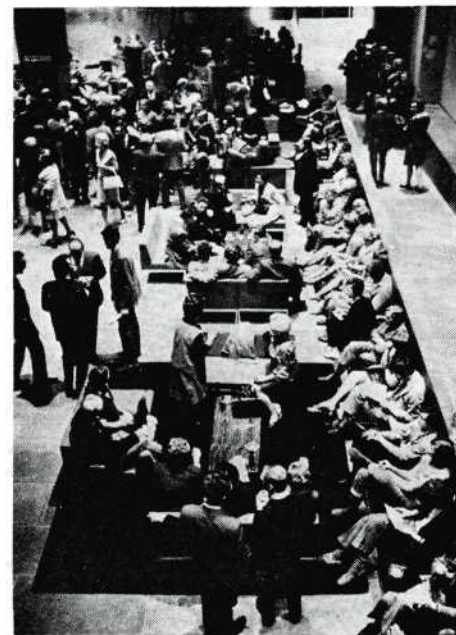
Een klein deel van het publiek tijdens de koffie-pauze.

Notitie: Het oude grapje om alleen de benen te laten zien zodat de kijker de ge-