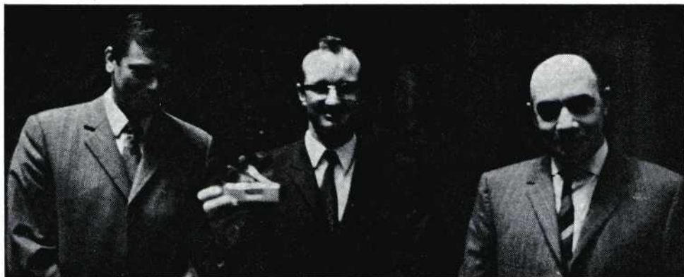
De makers van 'De leugen omtrent Willem Peer', de groep 'Flop'.

Mondo Magazine , animationfilm van G. v. Dijk. Korte inhoud: satire op de geillustreerde week- en sexbladen. Notitie: knap werk, met gevoel voor bizarre beeldcomposities. Een duidelijk eigen karakter.