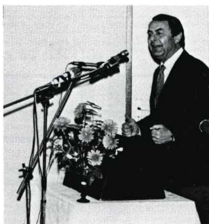
Fons Rademakers: 'Word filmgek... als u het tenminste nog niet bent!!'

Vooraf 'losse' filmers en filmsters, als ik hen losjes zo noemen mag. Mensen van wie er velen niet het flauwste idee hebben van de hoeveelheid kennis en ervaring waarover een filmklub beschikt. 'Lumière' heeft die niet onder stoelen of banken gestoken. Je zou kunnen zeggen: 'Lumière' heeft een en ander in een aantal stands keurig 'ter tafel' gebracht.